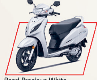
Pearl Precious White