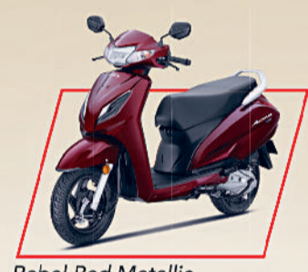
Rebel Red Metallic