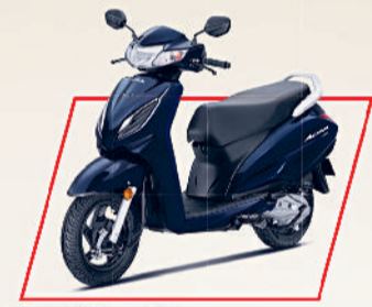
Pearl Siren Blue