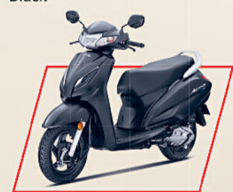
Matte Axis Grey Metallic